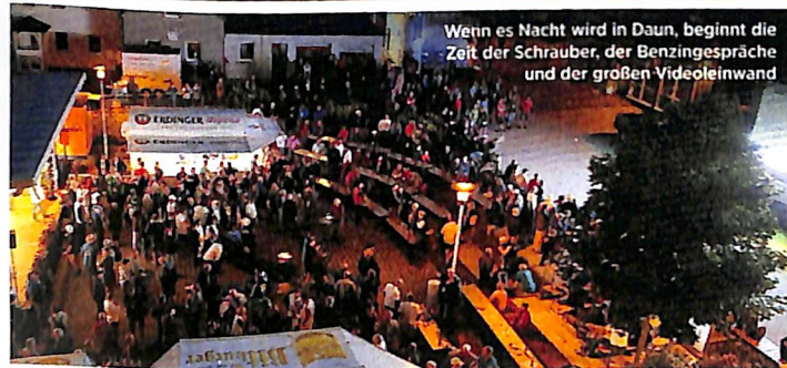
Wenn es Nacht wird in Daun, beginnt die Zeit der Schrauber, der Benzingsprache und der großen Videowand