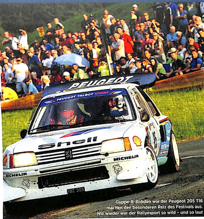
Gruppe-B-Boliden wie der Peugeot 205 T16 machen den besonderen Reiz des Festivals aus. Nie wieder war der Rallyesport so wild – und so laut