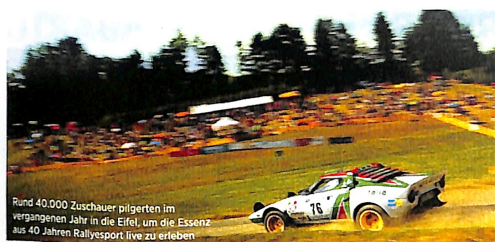
Rund 40.000 Zuschauer pilgerten im vergangenen Jahr in die Eifel, um die Essenz aus 40 Jahren Rallyesport live zu erleben