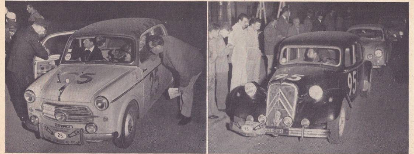
A sinistra la Fiat 1100 TV di Alquati-Prudenzeno, al controllo ai Trieste. A destra, Morolli e Graziano su Citroen durante un controllo notturno.

Off. ALFIERI MASERATI S.p.A. - Viale Ciro Menotti, 322 - Modena