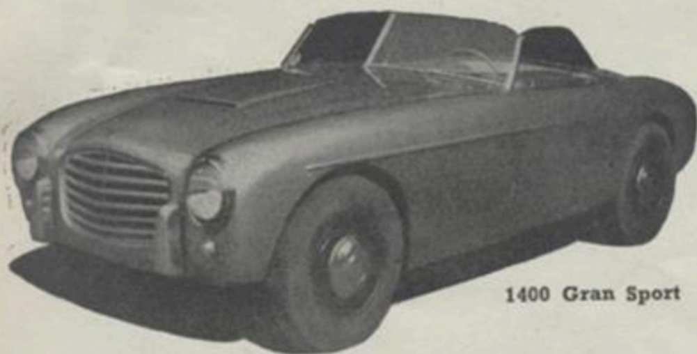
1400 Gran Sport