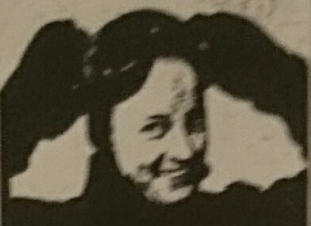
La sportiva Giuliana Minuzzo, che nella gara di slalom del Kandahar ha vinto la Coppa del Mondo.