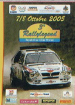
6.- Entre tanto coche oficial, más de uno repetía en sus puertas los mismos pilotos, como en este Fiat 131 Abarth donde se aprecian los nombres de Alen y Kivimaki. 7.- El Talbot Sunbeam-Lotus de Rosati era posiblemente uno de los coches más feos de la lista de inscritos, pero ¡como corría!. 8.- En acción el espectacular Porsche 911 Carrera RSR conducido por Walter Röhrl. 9.- Sandro Munari recuerda muy bien cómo se pilota un Stratos. 10.- El gran Markku no brilló especialmente en este Rallylegend. 11.- Lancia Delta S4 ex Grifone de Falleri-Farnocchia (atentos a la boca abierta del aficionado). 12.- Los Opel Ascona 400 de Conrero fueron conducidos en otra época por Biasión, Fassina, etc.