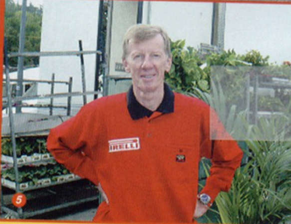
1.- En el Rallylegend no es bueno irse después de que pasen los primeros, ya que con el número 134 te puedes encontrar a un Stratos como el de la foto. 2.- Calzolari es un auténtico ídolo local en San Marino. Puro espectáculo. 3.- "Totò" Riolo, campeón italiano de clásicos de rali, currándose el segundo puesto. 4.- Más que espectacular, la presencia de los Lancia Grupo B ex oficiales, ahora en manos privadas. 5.- Vimos muy en forma a Walter Rohrl con su Porsche 911 3 litros, parece como si los años no pasaran por el alemán.